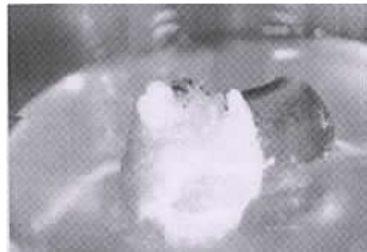
(A) Compact yellow callus from petiole of Champaign variety