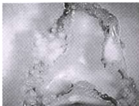
(C) Meristematic nodular callus from leaf lamina of Duang-sa-morn variety