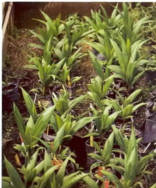
Seedling without GA 3 application