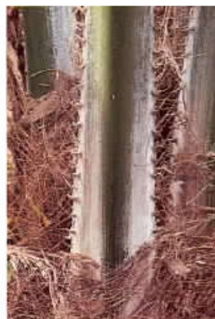
Frond of male tree