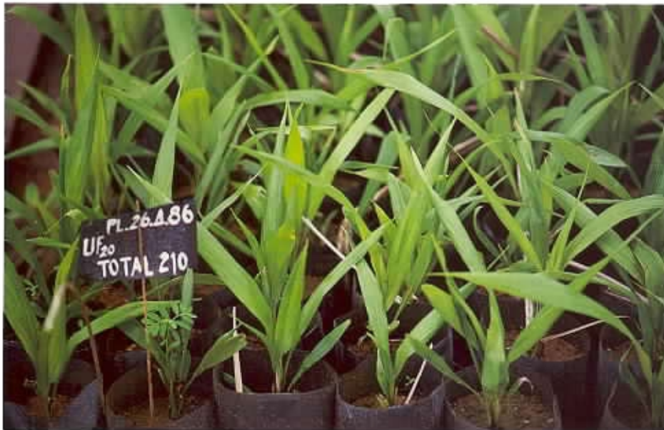
Seedlings from GA 3 application